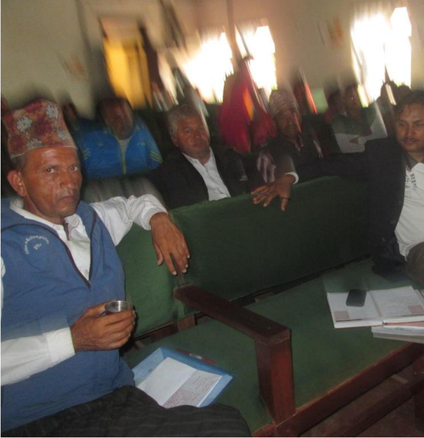
सामाजिक परीक्षणका सहभागिहरु